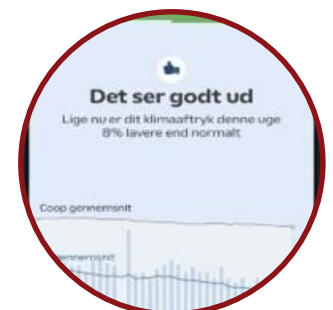
Klimapåvirkning i Coop APP