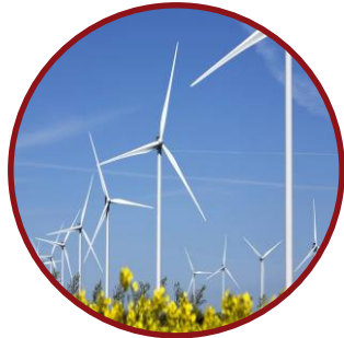
Købe grøn strøm