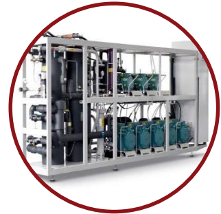
Udfase HFC køleanlæg