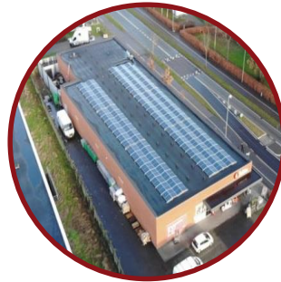
Vedvarende energi i butikker