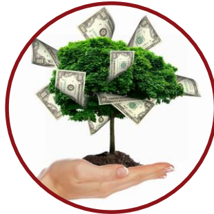
Klimapulje til Kategori