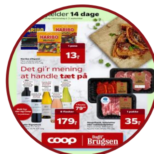
Øget grønt kampagnetryk