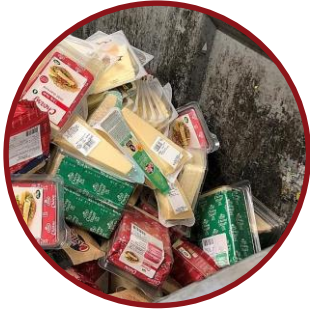
Fortsætte kampen mod madspild