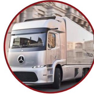
Teste grøn transport